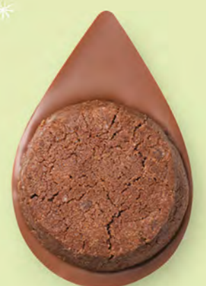
BISCUIT BROWNIE Chocolat au lait 35% de cacao