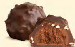
Chocolat noir 60% de cacao