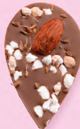
LE SONGE DE JULIETTE Chocolat au lait 35% de cacao, amande, éclats de nougat, brins d'anis