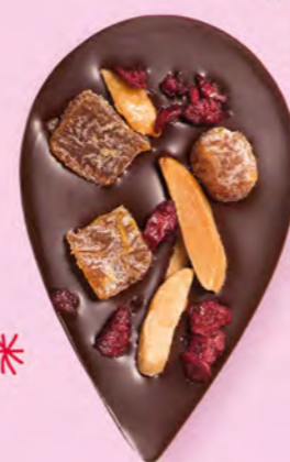
JULIETTE & TOM Chocolat noir 60% de cacao, dés d'abricots secs, amandes caramélisées et morceaux de cerise