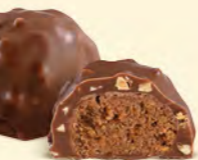
Chocolat au lait 36% de cacao

Éclats croustillants, praliné ultra fondant, finesse du chocolat d'enrobage... les rochers sont les grands classiques de notre maison.