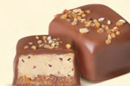
Duo gianduja noisettes et crème au beurre avec éclats de fèves de cacao et de noisettes