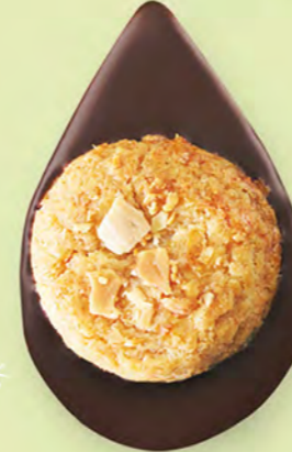
BISCUIT AMANDES Chocolat noir 60% de cacao