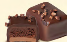
Duo gianduja noisettes et crème au beurre chocolat noir