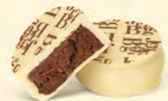
SAO TOMÉ Chocolat blanc