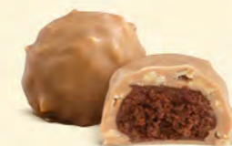
Chocolat blanc caramélisé