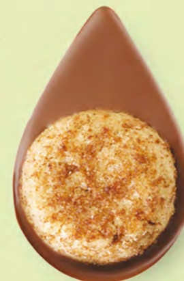
BISCUIT NOISETTES Chocolat au lait 35% de cacao

Un biscuit sablé artisanal posé sur un très bon chocolat ! C'est simple et c'est divin.